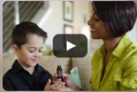
Why is dōTERRA Different?

Our pure essential oils are revolutionizing the way families manage their health. We harness nature's most powerful elements and share these gifts through our global community of Wellness Advocates.